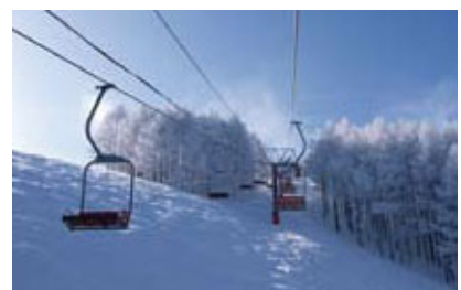
国設第三ペアリフト