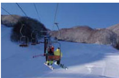
国設第一ペアリフト